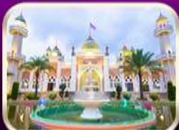
ชมมัสยิดกลางปัตตานี