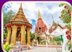
ขอพรหลวงปู่ทวด วัดช้างให้