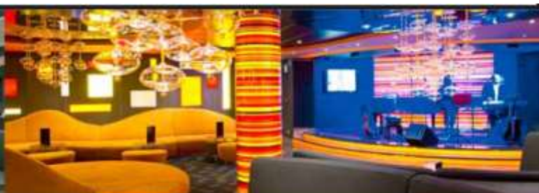
GOLDEN JAZZ BAR