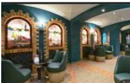
LA CANTINA DI BACCO