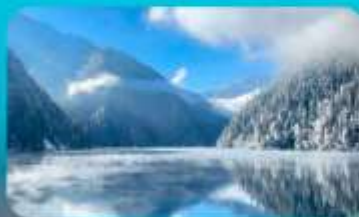
จี๋จ้ายโกว