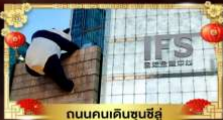
ถนนคนเดินชุนชี่อู่

เที่ยวอุทยานสวรรค์ระดับ 5A จิวจ้ายโกว "กู๋เขาสีดรุณี" อุทยานชื่อดังเหนียงชาน