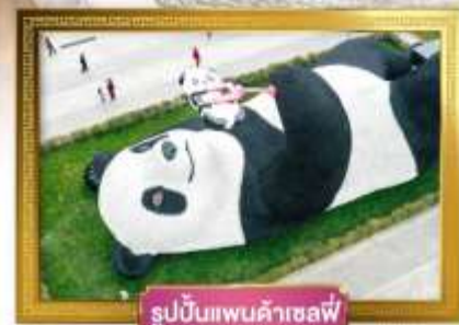
รูปปั้นแพนด้าเซลฟี่