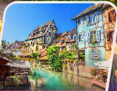
เที่ยวแคว้นอาลซัส