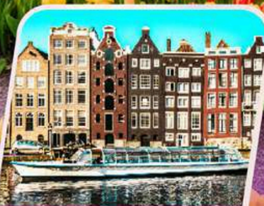
ล่องเรือหลังคากระຈก