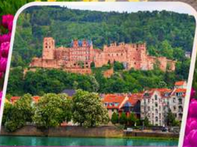
เข้าชมปราสาทไฮเดลเบิร์ก