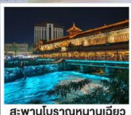
สะพานโบราณหนานเฉียวเฉียว