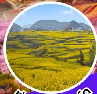
ทุ่งดอกมัสตาร์ด