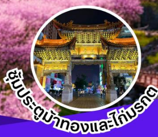
เยี่ยมชมมั่วทงและไท่บรต