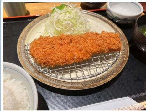
ร้าน Tonkatsu Maisen Shibuya Hikarie