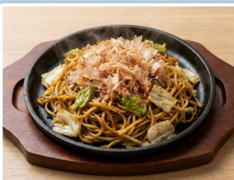
ร้าน Teppan Yatai