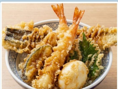
ร้าน Kaneko Hannosuke