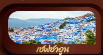
เชฟชาอูน