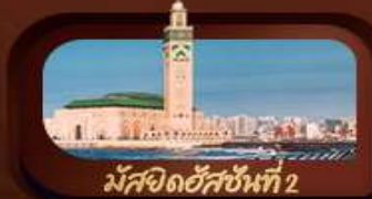
มัสยิดฮัสซันที่ 2