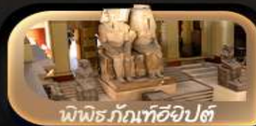
พิพิธภัณฑสถานอียิปต์

🍴 อาหาร 9 มื้อ + บนเครื่อง + 🏨 ที่พักโรงแรมดี 4 ดาว + 🚰 บริการน้ำดื่ม 5ลิตร: 2ขวด + 📺 ฟรีปลั๊กไฟ Universal