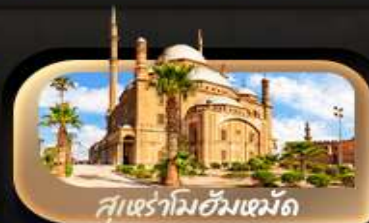
สุเหร่าอิบน์ตุลูน