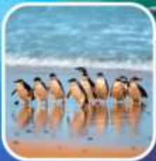
เพนกวินที่เกาะฟิลลิป