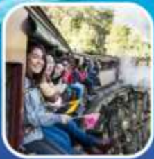
รถไฟจักรไอน้ำโบราณ