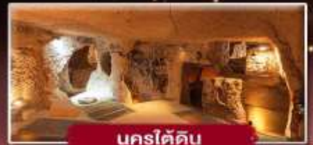
นครใต้ดิน