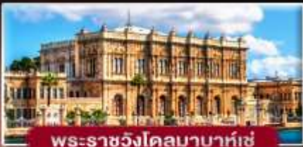
พระราชวังโดลมาบาห์เซ่