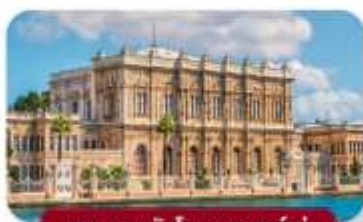
พระราชวังโดลมาบาห์เซ่