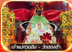
เจ้าแม่กวนอิม - วัดสองฮ่า