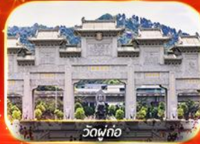
วัดฟ่งทอ

ตะลุยสวนสนุก CHIMELONG!! โถงใต้ถุนน้ำสวดขอพรตามต้นฉบับคนท้องถิ่น