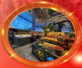
มือพิเศษ บุฟเฟต์นานาชาติ