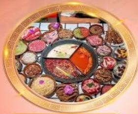
บุฟเฟต์หม้อไฟลงช้าง