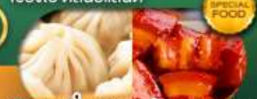
พิเศษ เสี้ยวหลงเป่า หมูแดงพอ เดินทาง ม.ค. - มิ.ย. 69