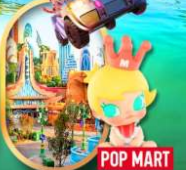
เลือกซื้อทัวร์เสริม เซี่ยงไฮ้ ดิสเนย์แลนด์

เซี่ยงไฮ้ หางโจว ล่องทะเลสาบซีหู ฟรีเดย์