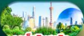
จุดเช็กอินสุดฮิต

เซี่ยงไฮ้ หางโจว ล่องทะเลสาบซีหู ฟรีเดย์