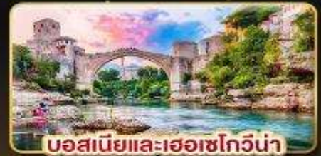
บอสเนียและเฮอซโกวีน่า