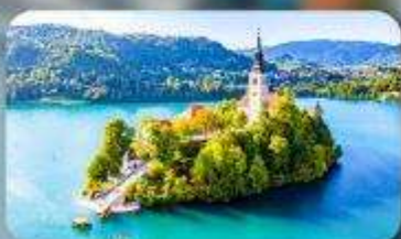
โบสถ์พระแม่มาเรียแห่งเบลค