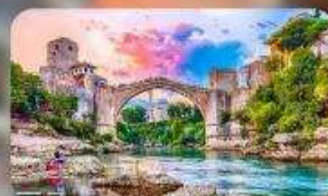
บอสเนียและเฮอร์เซโกวีนา