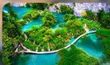
อุทยานแห่งชาติพลิตวิเซ