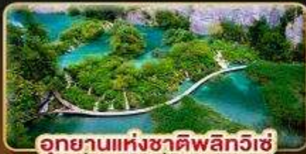
อุทยานแห่งชาติพลิตวิกิ