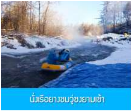
บั้งเรือยาวชมภูซยามเช้า

จากนั้นนำท่านเที่ยวชม อุทยานหยุนต้งเทียนกง 云顶天宫 เป็นอาคารหิมะขนาดใหญ่ที่มีรูปลักษณ์คล้าย พระราชวังในนวนิยายชื่อดังของจีน สร้างขึ้นจากหิมะกว่า 80,000 ลูกบาศก์เมตร มีความสูง 20 เมตร และกว้าง 60 เมตร บนเนื้อที่ 15,000 ตารางเมตร ในช่วงหัวค่ำจะมีการประดับไฟสวยงาม เริ่มเปิดให้นักท่องเที่ยวเข้าชมในเดือน ธันวาคม 2024 ปัจจุบันที่นี่ได้กลายเป็นแหล่งท่องเที่ยวและจุดเช็คอินขึ้นชื่อของเมืองฉางไป๋ซาน..... พักที่ JINSHUIHE HOTEL โรงแรมระดับ 4 ดาวท้องถิ่นหรือเทียบเท่า ในเมืองฉางไป๋ซาน ภายในโรงแรมมีบริการแช่น้ำแร่ กรุณาเตรียมชุดว่ายน้ำเพื่อแช่น้ำแร่ในโรงแรมที่พัก