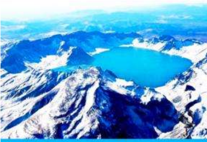
ยอดเขาฉางไป่ชาน