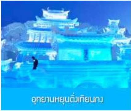
อุทยานหยุนต้งเทียนกง