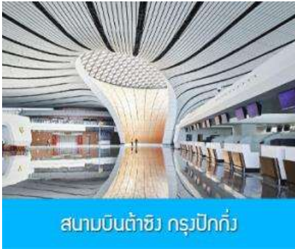
สนามบินต๋ำซิง กรุงปักกิ่ง