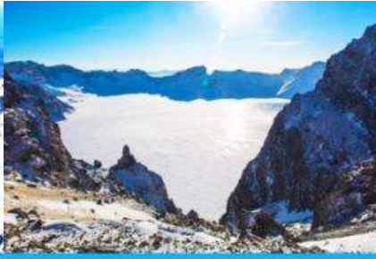
ทะเลสาบเทียนฉือ