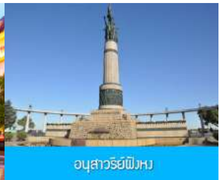
อนุสาวรีย์ฝั่งหวง