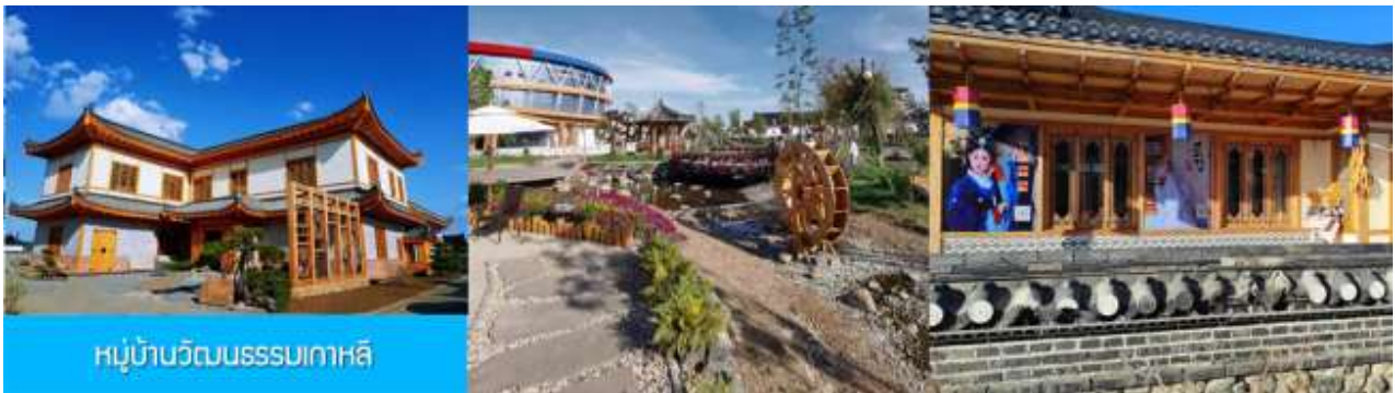
หมู่บ้านวัฒนธรรมเกาหลี