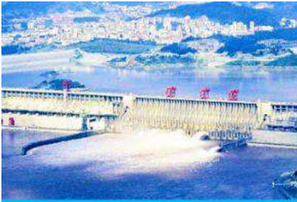
เขื่อนเก้อโจวป้า