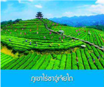
ภูเขาไรชาอู่เจียไถ