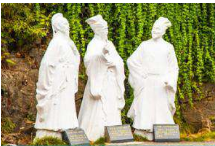
อุทยานถ้ำสามสหาย

สิ้นสุดโปรแกรมล่องเรือ นำคณะขึ้นฝั่ง ณ ท่าเรือหวงไปเหอ