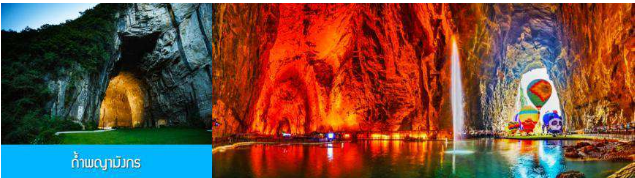
ถ้ำพญามังกร

พักที่ ENHSI JINMA HOTEL โรงแรมระดับ 4 ดาวหรือเทียบเท่าในเมืองเินซือ