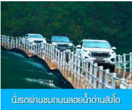
นั่งรถผ่านซบคนลอยน้ำด่านสิงโต