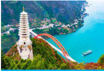
เมืองหยี่ชาง