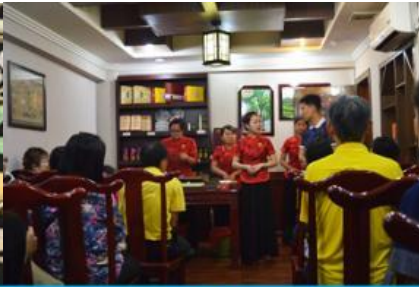
ร้านใบชา