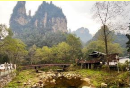
จุดชมวิวจีนเปียนซี

หลังอาหารเช้าให้ท่านพักผ่อนตามอัชฌาศัยใน โรงแรม หรือ ท่านสามารถเลือกซื้อโปรแกรมเสริม OPTIONAL TOUR รายการใดรายการหนึ่ง ซึ่งเป็น โปรแกรมท่องเที่ยวที่ไม่ได้รวมอยู่ในรายการท่องเที่ยว ซึ่งมีด้วยกัน 3 โปรแกรม ได้แก่