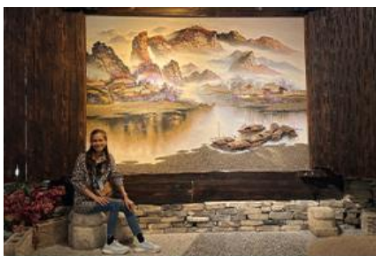
พิพิธภัณฑ์ภาพเขียนหินทราย

พักที่ ZHENMIAN HOTEL OR YINXIANG HOTEL ระดับ 4 ดาวท้องถิ่นหรือเทียบเท่าในเมืองจางเจียเจี๋ย