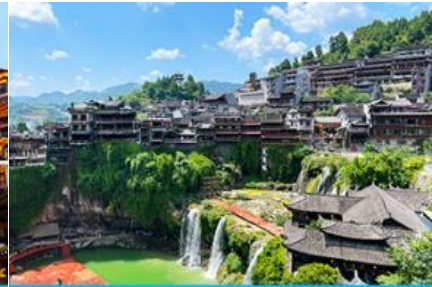
เมืองโบราณฝูหรงจิน

วันที่สาม เมืองจางเจียเจีย-ศูนย์จำหน่ายผลิตภัณฑ์ยางพารา-ตึกมหัศจรรย์ 72 ชั้น-เมืองโบราณฝูหรงจินยาม ค่ำคืน