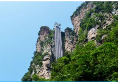
ลิฟท์แก้วไปหลาง