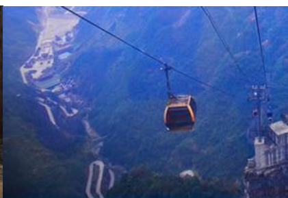
กระเช้าขึ้นเขายเทียนเหมินซาน