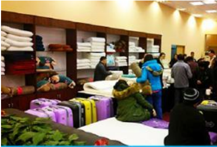
ศูนย์จำหน่ายผลิตภัณฑ์ยางพารา

พักที่ ZHENMIAN HOTEL OR YINXIANG HOTEL ระดับ 4 ดาวท้องถิ่นหรือเทียบเท่าในเมืองจางเจียเจีย