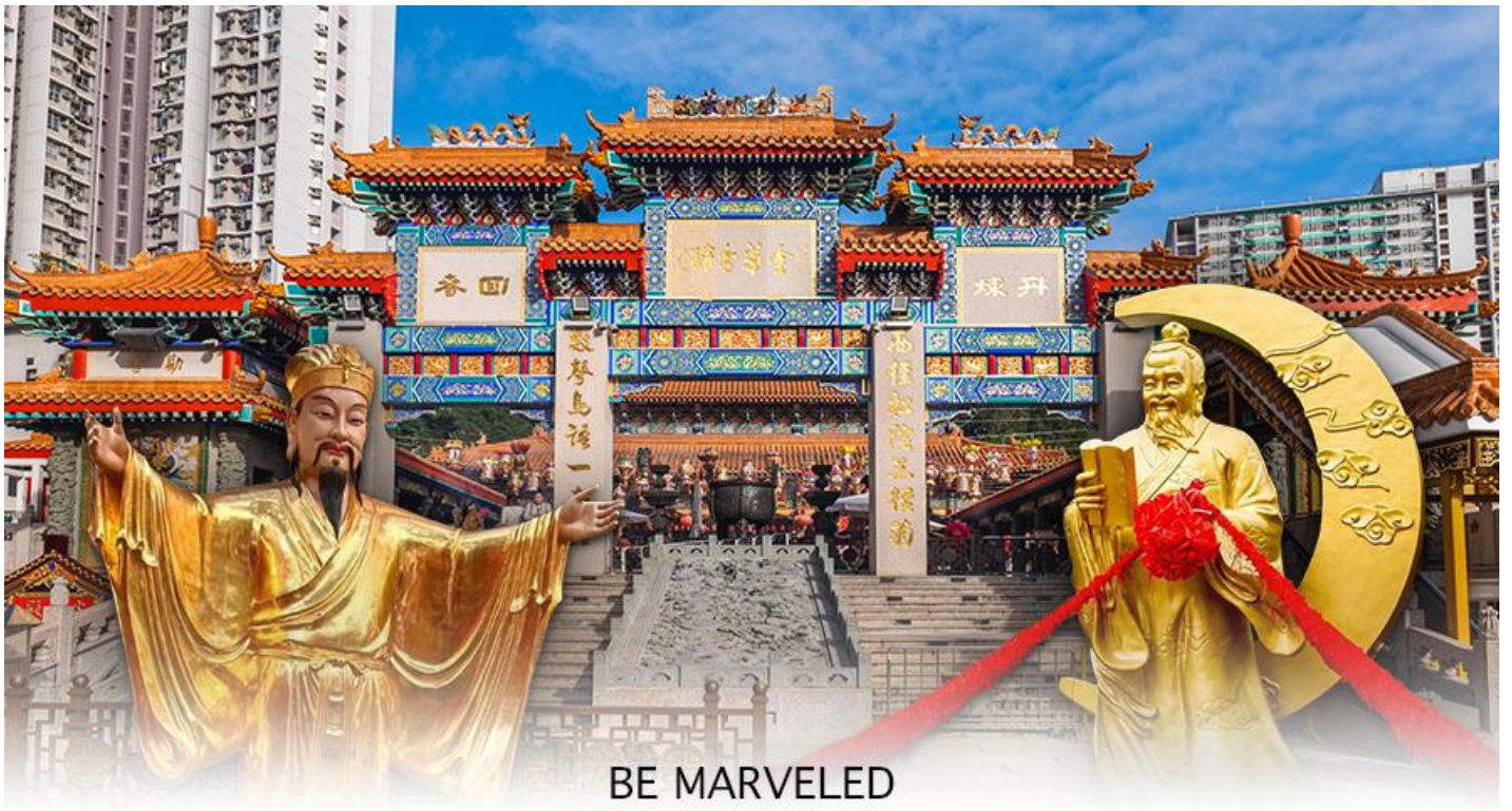
BE MARVELED วัดหวังต้าเซียน

พระหวังต้าเซียน หรือที่รู้จักกันในชื่อ ฮวงชูปิง (Huang Chu-ping) ในช่วงประมาณศตวรรษที่ 4 ได้เดินทางจากเมืองจินมาเผยแพร่ศาสนาในฮ่องกง และสร้างวัดแห่งนี้ขึ้นมาเมื่อประมาณปีค.ศ. 1921 ละ ภายในวัดจะมีทั้ง เทพเจ้าหวังต้าเซียน, เจ้าแม่กวนอิม, เจ้าที่, เทพเจ้าหยุกโหลว (เทพเจ้าแห่งความรัก), ท่านขงจื้อ ซึ่งคนฮ่องกงเอง และนักท่องเที่ยวก็จะมาราบไหว้เพื่อสิริมงคลกัน โดยเฉพาะอย่างยิ่งคือ เทพเจ้าหยุกโหลว หรือ เทพเจ้าแห่งความรัก ที่เราเรียกกันว่า เทพเจ้าด้ายแดง เป็นพิภคที่หลายๆ คนมักจะไปขอความรักจากท่านกัน นอกจากนี้เราจะต้องเอาด้ายแดงมาพันมือนีว ตามป้ายที่แนะนำข้างหน้าแล้ว ไกด์นำเที่ยวคนฮ่องกงบอกมาว่าถ้าเป็นผู้หญิงอย่างเราอยากได้แฟน ก็ต้องไปผูกด้ายที่รูปปั้นผู้ชายและพอไหว้เสร็จแล้วก็อย่าลืมหยอดทำบุญใส่ตู้ไปด้วย