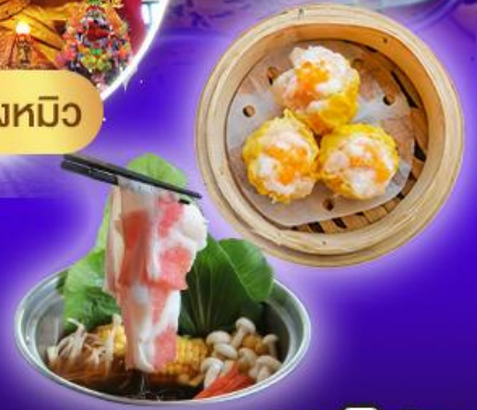
วัดแซกทมิว