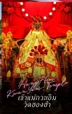
Hung Hom Kowloon Yau Temple เจ้าแม่กวนอิม วัดสองฮา