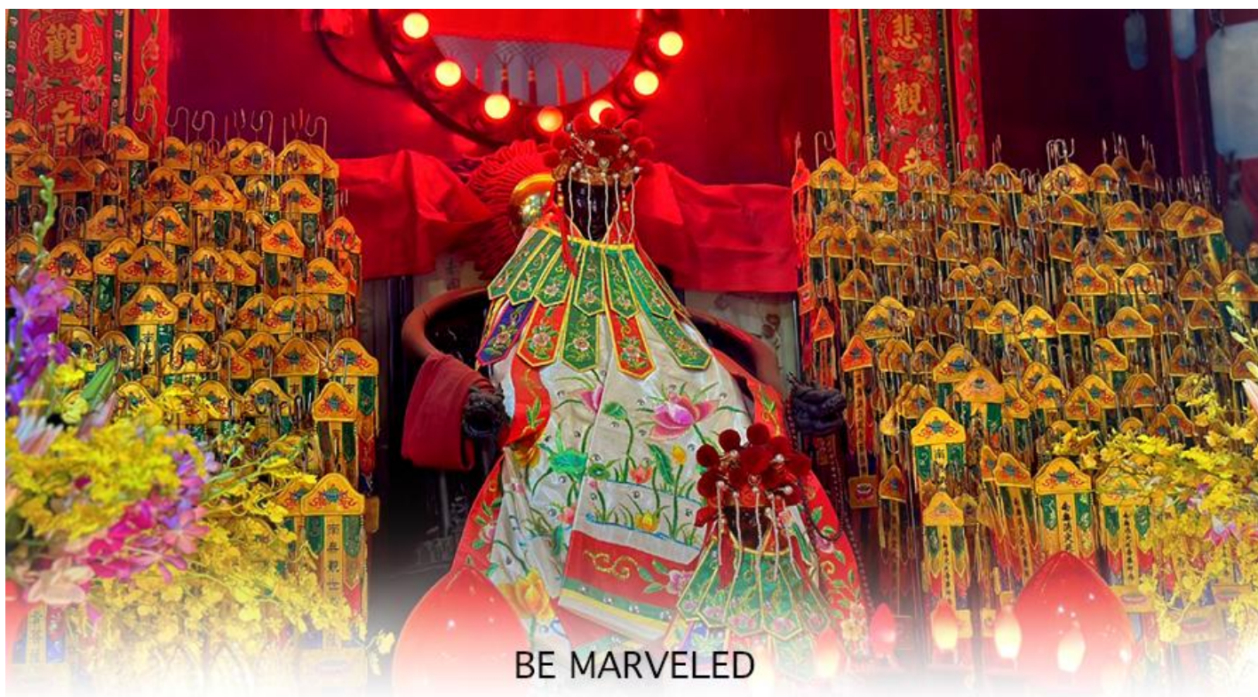
BE MARVELED วัดเจ้าแม่กวนอิมฮองอำ (ยิมฮิน)

มาเก่า จะมี "วันเปิดทรัพย์" หรือ "พิธียืมเงิน เจ้าแม่กวนอิมฮ่องกง" เป็นวันที่จะมาขอพรและยืมเงินเจ้าแม่กวนอิม ซึ่งนับจาก หลังวันตรุษจีน ไป 26 วัน จะเป็นวันเปิดทรัพย์ที่จัดขึ้นในทุกๆปี พิธีนี้จะมีเพียงครั้งปีละครั้งเท่านั้น เป็นวันสำคัญอีกวันที่คน หลังไหลมาไหว้ขอพรอย่างไม่ขาดสาย