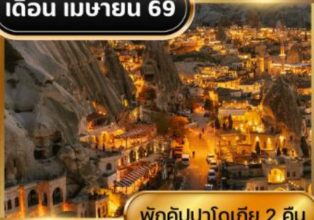
พักคัปปาโดเกีย 2 คืน