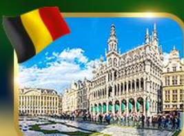
จัตุรัสกรอนด์ ปลาซ บริซเซลส์