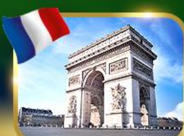
ประตูชัยฝรั่งเศส ปารีส