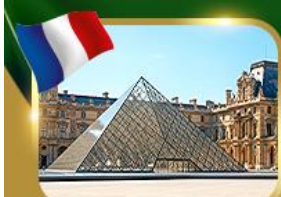
พีระมิดที่ลูฟวร์ ปารีส