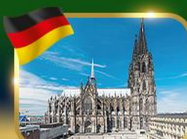
มหาวิหารแห่งเมืองโคโลญ