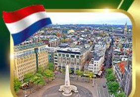
จัตุรัสดีนสแควร์ ฮัมสเตอร์ดัม