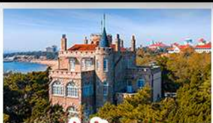
ป่าตึกวน

พระราชวังฤดูร้อน - วิวเมืองชิงเต่า รถไฟความเร็วสูง - ภูเขาเหลาซาน กำแพงเมืองจีนด่านจวิยงกวน - ป่าตึกวน พักโรงแรมระดับ 4 ดาว - ไม่ลงร้านช้อปปิ้ง มือพิเศษ เปิดปักกิ่ง , หม้อไฟซีฟู้ด