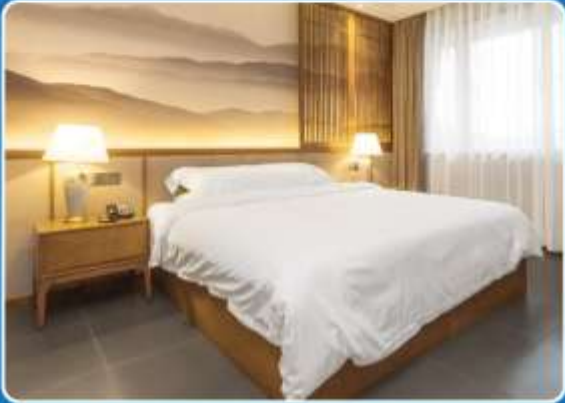
👤 SINGLE (SGL)