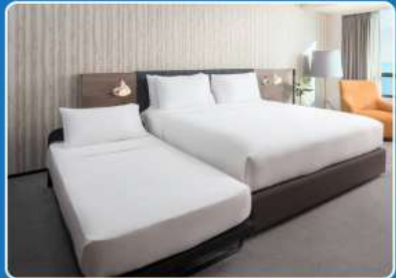
👤👤+👤 TRIPLE (TRP)

**รูปภาพห้องพักเป็นเพียงภาพสื่อถึงประเภทของเตียงเท่านั้น ไม่ใช่ภาพห้องพักจริงสำหรับการเข้าพัก**