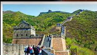
กำแพงเมืองจีนด่านจวิยงกวน