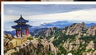
ภูเขาเหลาซาน