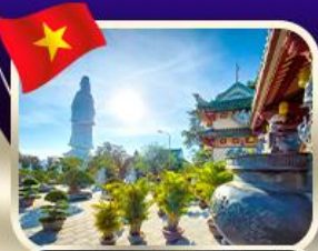
ขอพรกวณอิมวัดหลันอั้ง