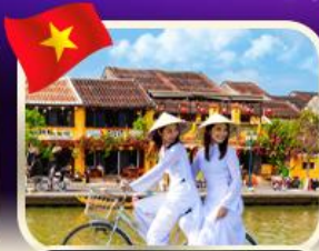
เช็คอินเมืองเก่าฮอยอัน