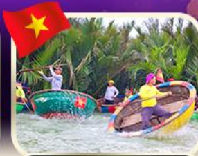
ล่องเรือกระด้งที่ทาน