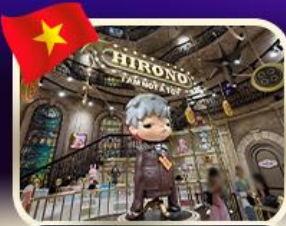
POPMART บานฮิเอป