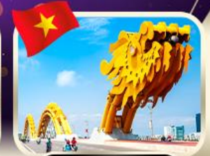
สะพานมังกร ดานัง