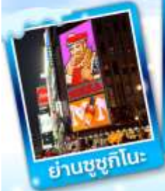
ย่านซูซุกิโนะ