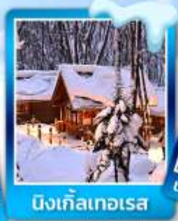
นิงเกิลเทอเรส