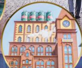
โรงงานเบียร์ชิงเต่า