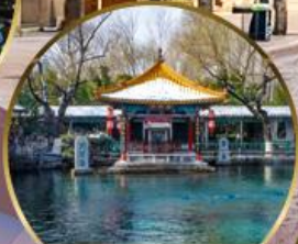
น้ำพุเปาหู