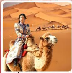
ขี่อูฐชมทะเลทราย

● ไอโอล์ก ชมความงามอุทยานหุบเขาคลิ้น มรดกโลกภูเขาสายรุ้ง ตามรอยวิถีชีวิต และพิภพระเืองของชาวมองโกเลีย