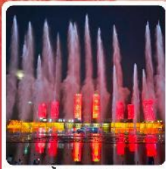
น้ำพุคังปาสือ