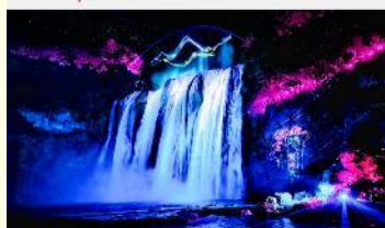
อุทยานน้ำตกหวงกั๋วชู่