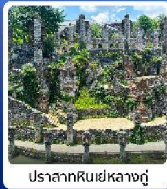
ปราสาทหินเย่หลางกู่

● ไฮไลท์ น้ำตกหวงกั๋วซู่ น้ำตกที่ใหญ่ที่สุดของจีน แหล่งท่องเที่ยวระดับ 5A ชมความสวยงาม หมู่บ้านวูเจียงจ้าย หมู่บ้านจินโบราณ