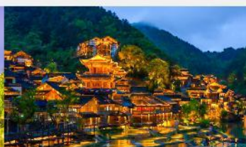
หมู่บ้านโบราณฉูเจียงจ้าย