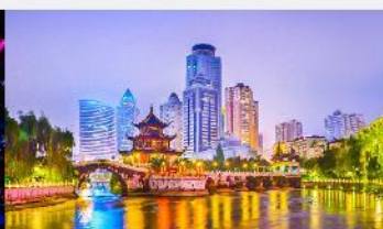
หอเจี่ยเซียวไหลว