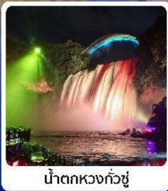
น้ำตกหวงกั๋วซู่