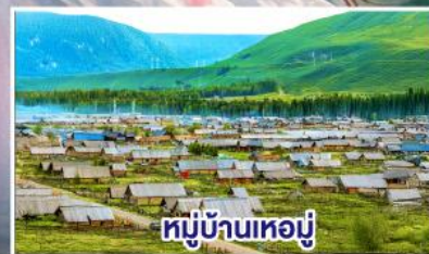
หมู่บ้านหอยมู