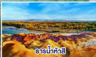
ธารน้ำห้าสี