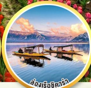
ล่องเรือชิคร่า