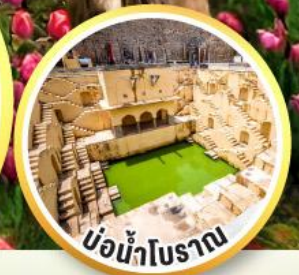
บ่อน้ำโบราณ