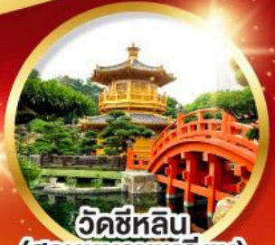
วัดซีหลิน (สวนหนานเท่ลิย่น)