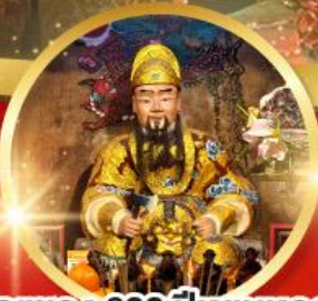
วัดเซกง 600 ปี หุ่นหลอง