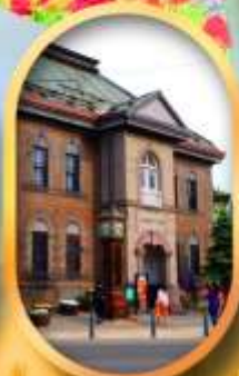
พิพิธภัณฑ์กล่องดนตรี