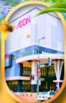
อ็อนมอลล์