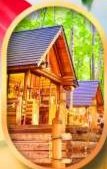
บึงเทิลเกอเรส