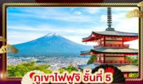
ภูเขาไฟฟูจิ ชั้นที่ 5

ชมลาวนเดอร์ ที่ สวนโออิชิปาร์ค อิสระ 1 DAY TRIP