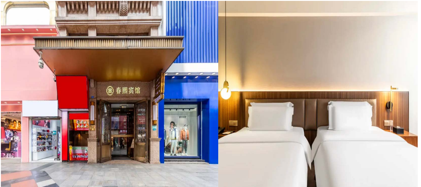
โรงแรมใจกลางย่านช้อปปิ้งชุนซีลู่

Cheangdu Chunxi Hotel ย่านช้อปปิ้งชุนซีลู่ หรือระดับเทียบเท่า พักห้องละ 2-3 ท่าน หมายเหตุ โรงแรมที่พัก จะแจ้งให้ท่านทราบ ก่อนเดินทางโดยประมาณ 5-7 วันทำการ