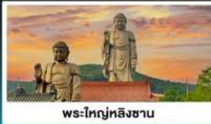
พระใหญ่หลิงซาน