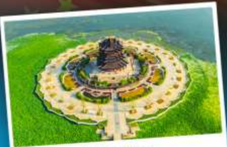
วัดทองหยวน

ล่องเรือชมป่าในน้ำทะเลสาบชิงชาน ไหว้พระใหญ่หลิงซาน เกียวมหนานครเซี่ยงไฮ้