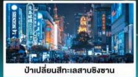
ป่าเปลี่ยนสีทะเลสาบชิงชาน