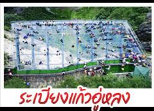
ระเบียงแก้วอุ้งหล่ง