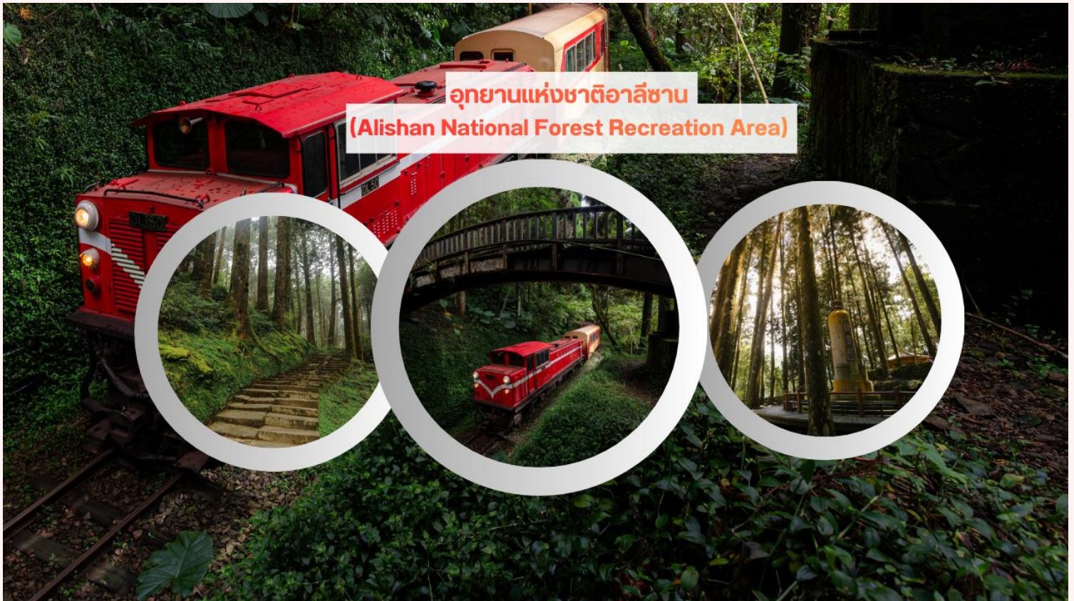
อุทยานแห่งชาติอlishan (Alishan National Forest Recreation Area)

กลางวัน รับประทานอาหารกลางวัน ณ ภัตตาคารพื้นเมือง (มื้อที่ 3) หลังจากนั้น นำท่านเดินทางต่อสู่ เมืองไทจง เมืองที่เต็มไปด้วย วัฒนธรรม, ศิลปะ, และรสชาติอาหารท้องถิ่น เพลิดเพลินกับการเดินชมตลาด, พิพิธภัณฑ์ และแลนด์มาร์คสำคัญต่าง ๆ พร้อมชิมเมนูเด็ดที่ขึ้นชื่อของเมืองนี้ นำท่านเดินเล่นที่ ตลาดกลางคืนไทจง สัมผัสชีวิตกลางคืนที่มีสีสันที่สุดของเมืองไทจงใน ตลาดกลางคืนชื่อดัง ที่รวมทั้ง อาหารท้องถิ่นรสเลิศ, ขนมหวานแสนอร่อย, และของฝากน่ารักๆ ให้เลือกสรรได้ไม่อั้น ท่ามกลางบรรยากาศคึกคักของ แสงไฟนีออนและผู้คน พร้อมชิมเมนูเด็ดที่ห้ามพลาด เช่น ของทอดสูตรเฉพาะ, ขานมไข่มุกสดใหม่, และขนมท้องถิ่น แบบดั้งเดิม นอกจากนี้ยังมี โซนช้อปปิ้งและของที่ระลึกสุดเก๋ ให้ท่านเลือกซื้อกลับบ้านเป็นของฝากหรือของที่ระลึกนับ ได้ว่าตลาดกลางคืนไทจง เป็นอีกหนึ่งในจุดหมายของนักชิมและนักช้อปปิ้ง ที่ไม่ควรพลาด