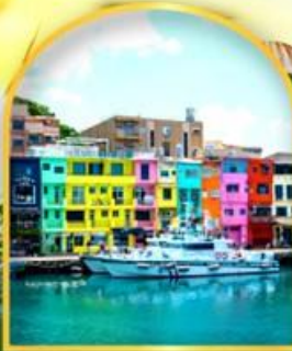
หมู่บ้านประมงหลากสี