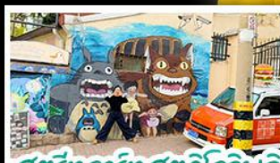
สตรีทอาร์ต สตูดิโอจิบลิ