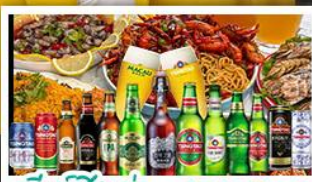
เบียร์ชิงเต่า + อาหารทะเล