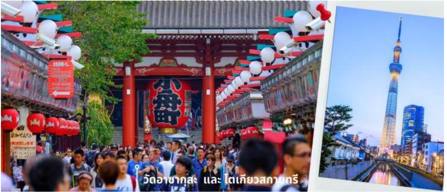
วัดอาซากุสะ และ โตเกียวสกายทรี

หอคอยที่สูงที่สุดในโลกตั้งอยู่ที่เขตสุมิตะหน้าที่หลักของโตเกียวสกายทรีคือการกระจายสัญญาณสื่อสารแบบดิจิตอล และโตเกียวสกายทรียังแทรกความเป็นมาของท้องถิ่นเอาไว้ด้วยความสูงของหอคอย 634 เมตร มาจาก มุซาชิคุนิชื่อเรียกในอดีตของแถบนี้ซึ่งตัวเลข 634 สามารถอ่านตามเสียงตัวเลขเป็นมุซาชิได้