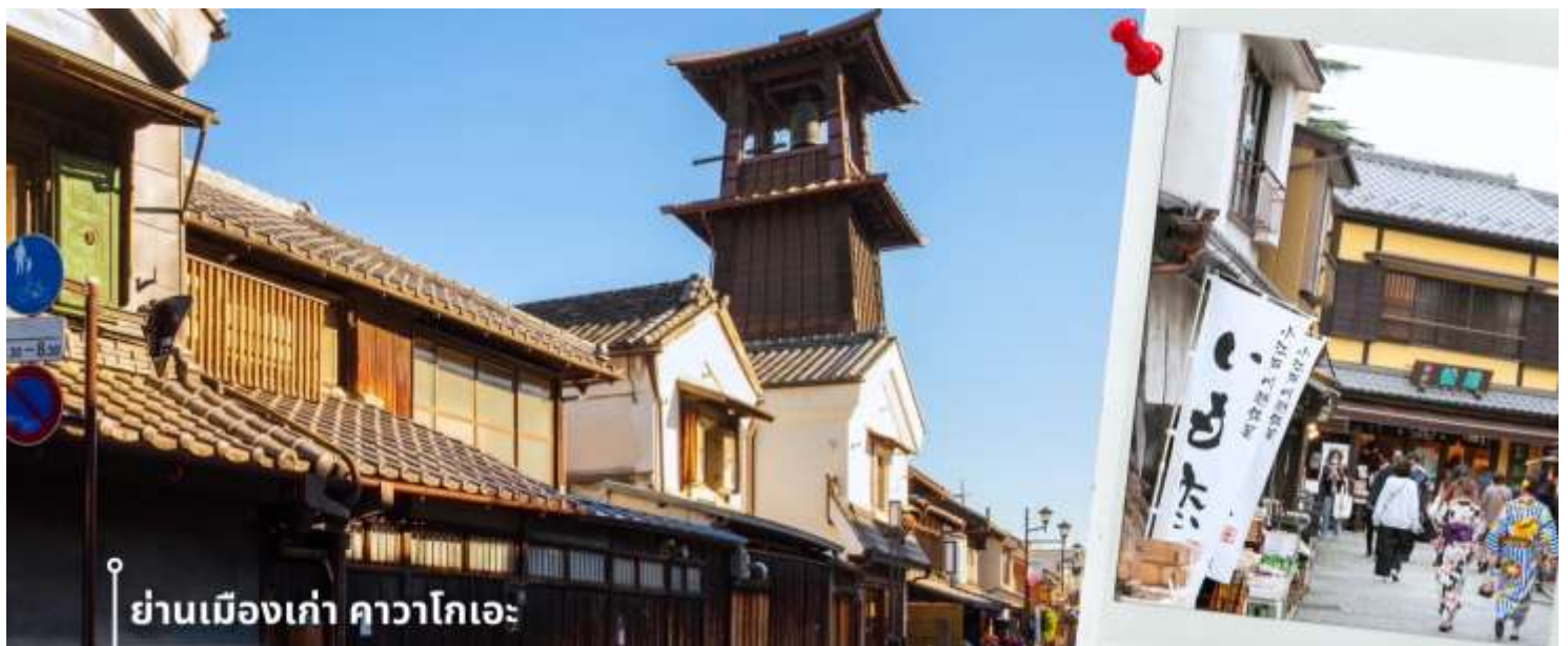
ย่านเมืองเก่า คาวาโกเอะ

หลังรับประทานอาหารเที่ยง นำท่านเดินทางสู่ ย่านเมืองเก่าคาวาโกเอะ เมืองเก่าที่ได้รับสมญานามว่า “เอโดะน้อย” ด้วยความโดดเด่นของอาคารสไตล์แบบญี่ปุ่นดั้งเดิม ที่เรียงรายสองฝั่งถนนอย่างมีเสน่ห์ รวบรวมได้ย้อนเวลากลับไปในยุคเอโดะ ใจกลางเมืองแห่งนี้คือ ถนนคุระซุคุริ Kurazukuri-dori ที่เต็มไปด้วยร้านค้าท้องถิ่น คาเฟ่ขนมหวาน และของฝากสไตล์ญี่ปุ่นโบราณ การเดินเล่นที่นี่ไม่ใช่แค่การเที่ยวชมสถาปัตยกรรม แต่ยังสามารถชิมบรรยากาศที่เงียบสงบ มีเสน่ห์เฉพาะตัว เหมาะสำหรับการถ่ายรูปและเรียนรู้วัฒนธรรมญี่ปุ่นในแบบที่จับต้องได้ สัญลักษณ์สำคัญของเมืองคือ “หอรบขังโทคิโนะคาเนะ” (Toki no Kane) ที่ยังคงดังบอกเวลาวันละ 4 ครั้ง เป็นเสียงแห่งอดีตที่ยังสะท้อนอยู่ในปัจจุบัน ไม่ไกลกัน มีถนนขนมหวานคาชิยะ โยโกโช (Kashiya Yokocho) ซอยเล็ก ๆ ที่เต็มไปด้วยกลิ่นหอมของมันหวาน ลูกอมโบราณ และขนมญี่ปุ่นหลากชนิด ให้เลือกชิมและซื้อกลับบ้านเป็นของฝาก ให้ท่านได้อิสระเดินเที่ยวชมตามอัธยาศัย