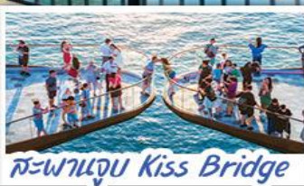
สะพานจูบ Kiss Bridge