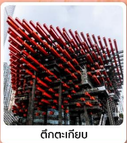
ตึกตะเกียบ