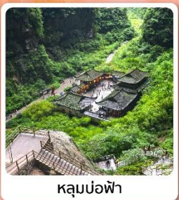
หลุมบ่อฟ้า