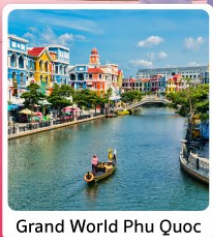
Grand World Phu Quoc