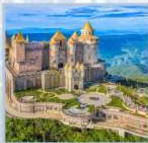
ปราสาทจันทร