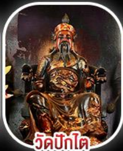
วัดบิกิต