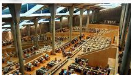
เขื่อนสิมุดอเล็กซานเดรีย