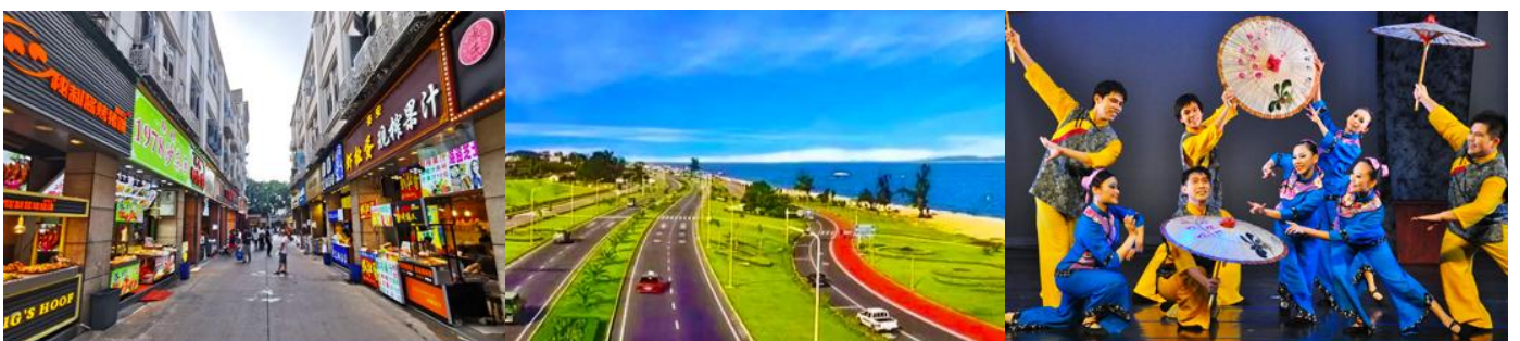
ถนนวซาลู่

พักที่ โรงแรม XIAMEN HENGLONG HOTEL 4* หรือเทียบเท่าในเมืองเซี่ยะเหมิน