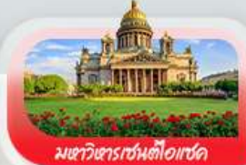
มหาวิหารเซนต์ไอแซค