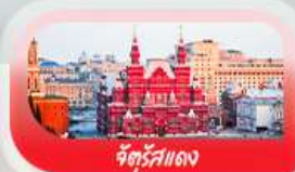
จัตุรัสแดง