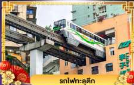
รถไฟฟ้า-ลูตัก