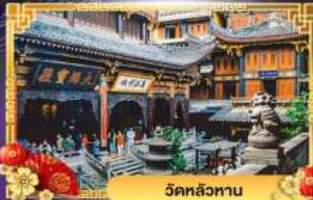
วัดหลัวหนาน