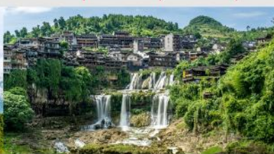
หมู่บ้านโบราณฝูหลงเจิน