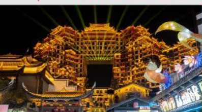
ตึกมหัศจรรย์ 72