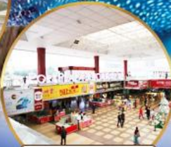
ตลาดกังเป๋ย