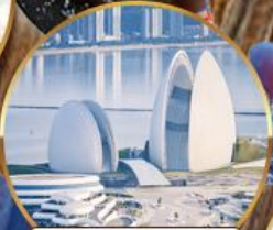
โรงละครหอยโข่มุก